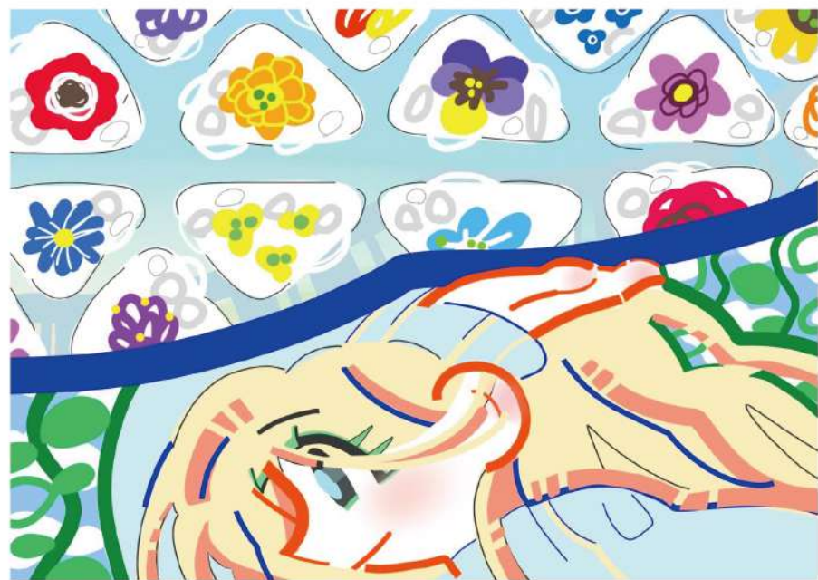
今回のテーマ: 「アツい北部」