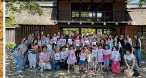
2023/07/02 GOTO南部トンポツアー