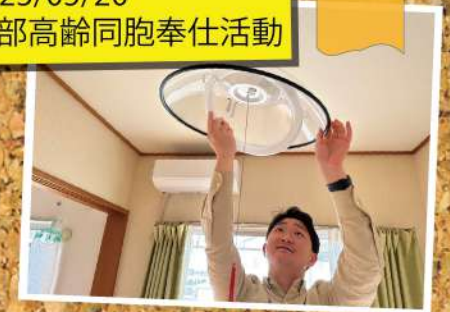
2023/05/20 西部高齢同胞奉仕活動