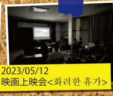
2023/05/12 映画上映会<화려한 휴가>