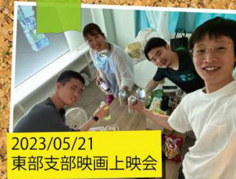
2023/05/21 東部支部映画上映会