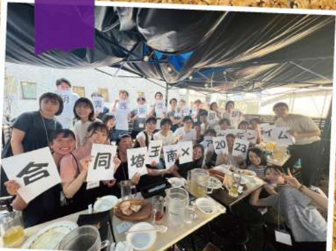
2023/06/25 西東京東部支部、埼玉南部支部合同行事