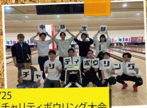
2023/04/25 中部支部チャリティボウリング大会