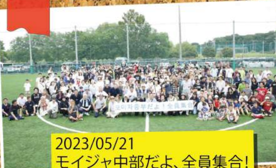
2023/05/21 モイジャ中部だよ、全員集合!