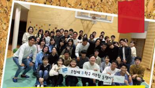
2023/05/14 東京第三学区支部合同イベント