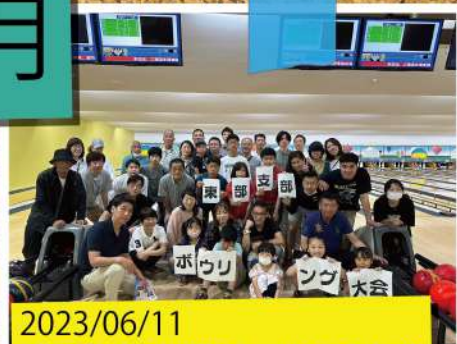
2023/06/11 総聯東部支部ボウリング大会