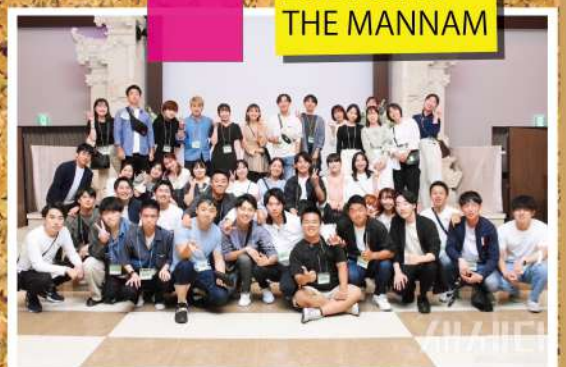
2023/05/28 THE MANNAM