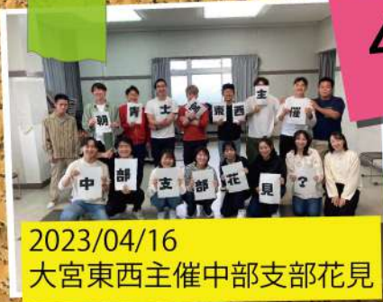
2023/04/16 大宮東西主催中部支部花見