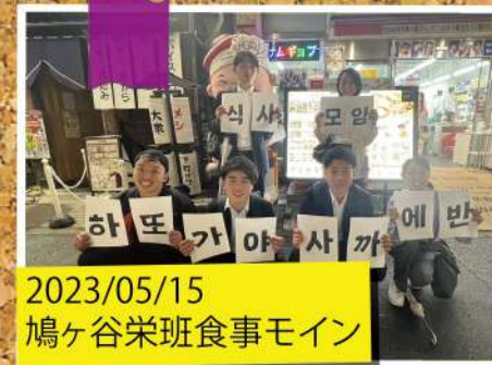
2023/05/15 鳩ヶ谷栄班食事モイン