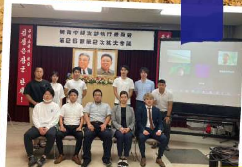
2023/06/17 朝青中部支部執行委員会第26期第2次拡大会議