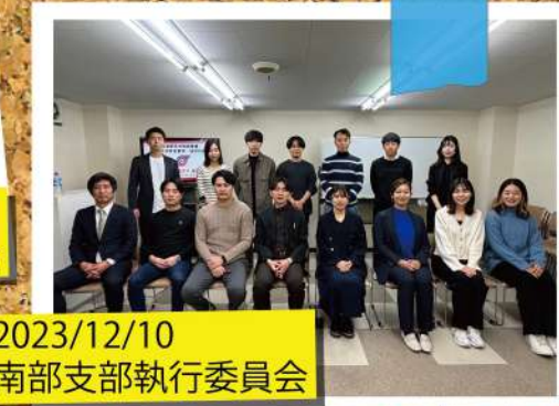
2023/12/10 南部支部執行委員会