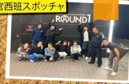
2023/11/02 大宮西班スポッチャ