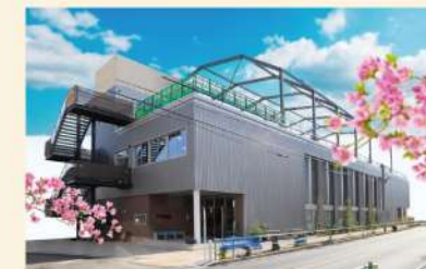
東京朝鮮第三ハッキョ 一口333円運動 一口千円運動