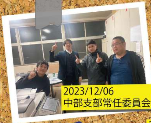
2023/12/06 中部支部常任委員会