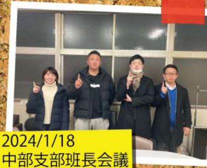
2024/1/18 中部支部班長会議