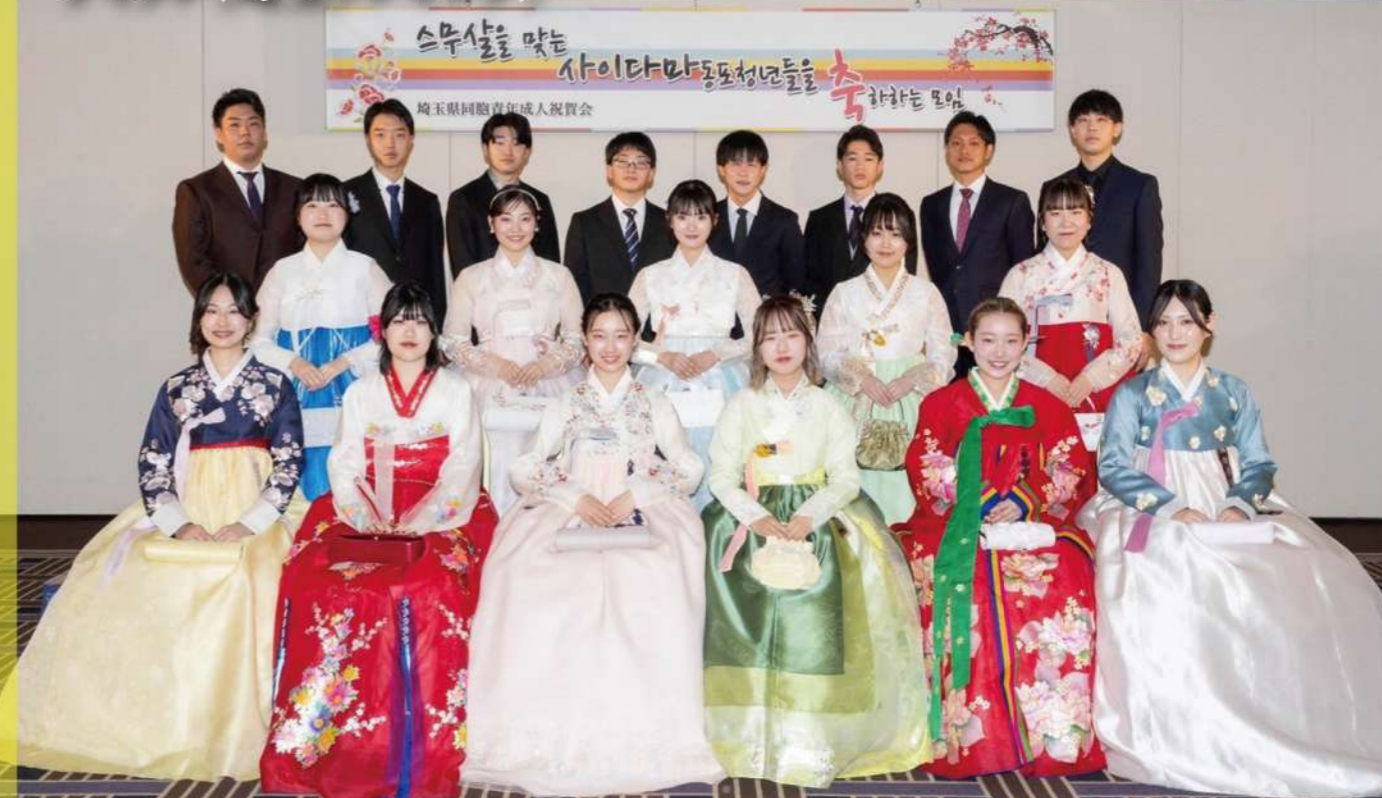
20歳を迎える埼玉同胞青年を 祝賀する会にて

成人式特集 ちゆいみナビ! 朝青写真館 大衆運動 etc. 朝青画伯展 BUNGEI info サイラン(埼玉ランキング)