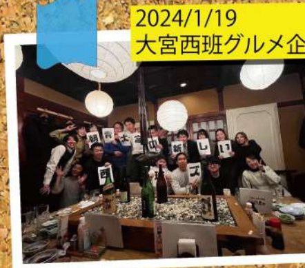
2024/1/19 大宮西班グルメ企画