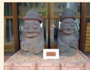
東京朝鮮第四ハッキョ 一口千円運動(今後)