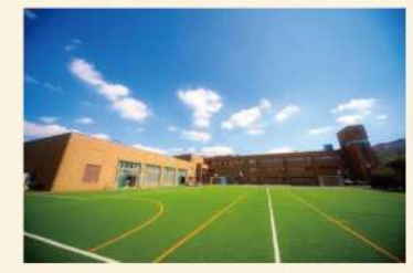
西東京朝鮮第一ハッキョ 連合同窓会※年間1000円 一口千円運動 (フォーラム機会に)