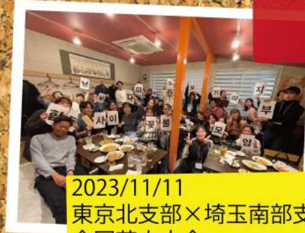
2023/11/11 東京北支部×埼玉南部支部 合同花火大会