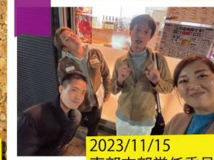
2023/11/15 東部支部常任委員会