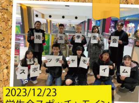
2023/12/23 学生会スポッチャモイン