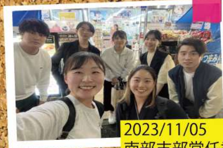
2023/11/05 南部支部常任委員会