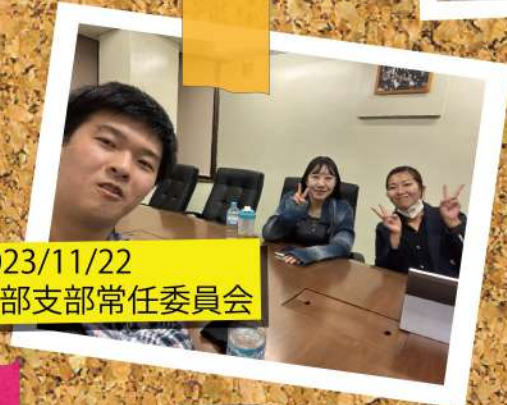
2023/11/22 北部支部常任委員会