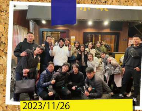
2023/11/26 連合同窓会オールド交流会