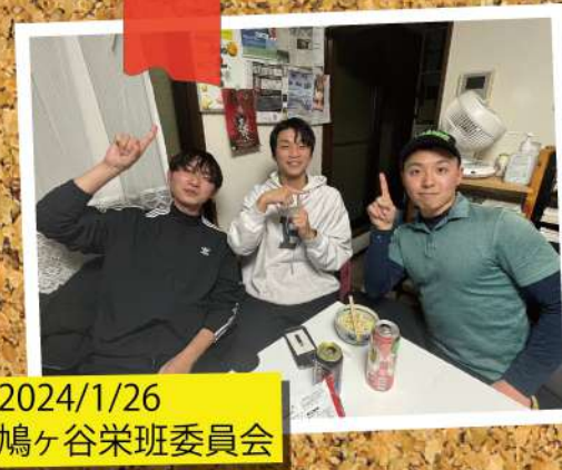
2024/1/26 鳩ヶ谷栄班委員会