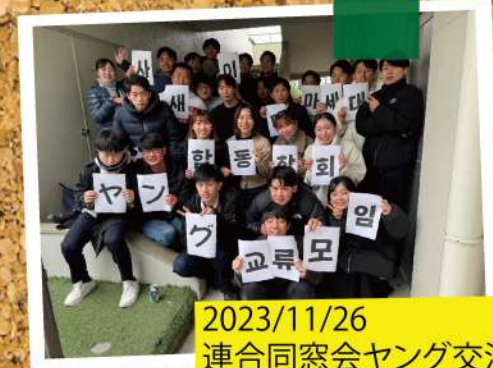
2023/11/26 連合同窓会ヤング交流会