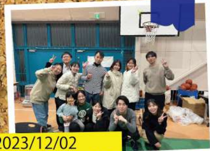
2023/12/02 南部カラオケ大会