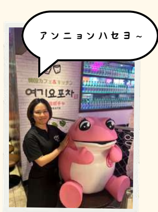
アンニョンハセヨ～