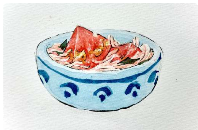
今回のテーマ：「埼玉キムチ」