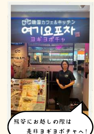
熊谷にお越しの際は是非ヨギヨポチャへ！